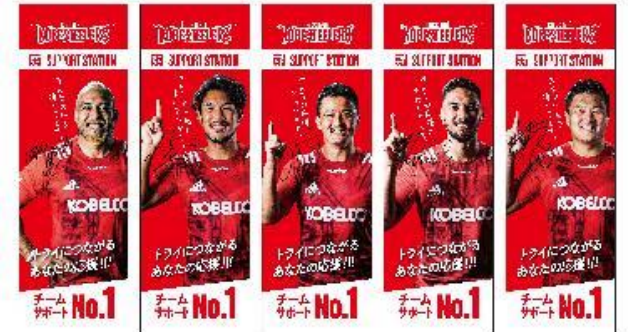
サポステ限定応援のぼり ※5種類のデザインの内いずれか2枚