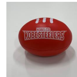
サイン入りミニボール