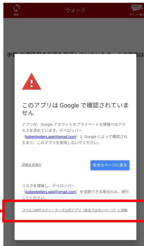
Step2 : コベルコ神戸スティーラーズ公式アプリに移動をクリックします。