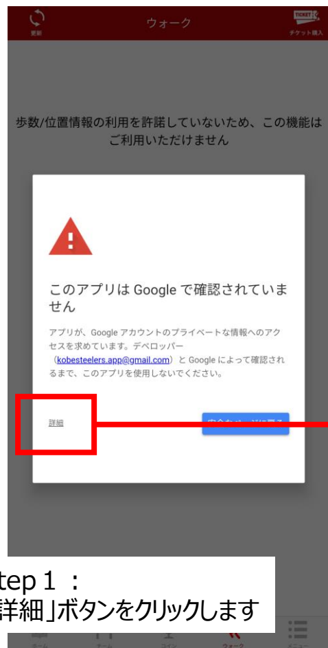
Step 1 : 「詳細」ボタンをクリックします

一部の端末でウォーク機能を利用する際に以下のエラーメッセージが出る場合がございます。お手数ですが、次の手順をお願い致します。お手数をおかけしますが宜しくお願い致します。