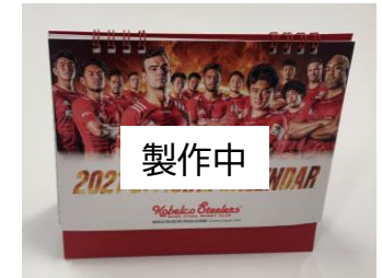
壁掛けカレンダー