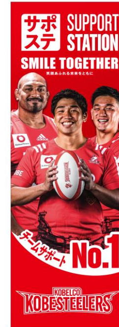
サポステ限定 応援のぼり